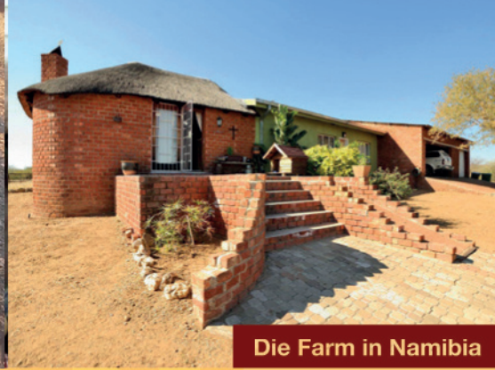
Die Farm in Namibia

tern errichtet. Im Januar 2020 zieht Nicole mit ihrer Tochter nach Windhoek, um mit ihren angesammelten Erfahrungen eine Therapiestelle für vollpflegebedürftige Kinder in Namibia ins Leben zu rufen.