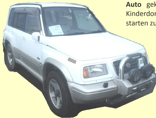
Mit dem aus Japan importierten Suzuki Jeep werden wir in Zukunft problemlos das Grundstück des Kinderdorfs erreichen können

Wie geplant haben wir inzwischen ein Auto gekauft, um mit dem Bau des Kinderdorfs in Tansania so richtig durchstarten zu können.