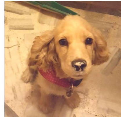
Welpen Pritty ist schon zu einer kleinen Hundedame herangewachsen