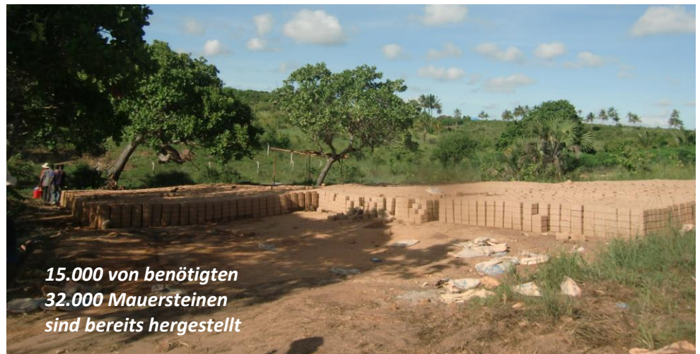
15.000 von benötigten 32.000 Mauersteinen sind bereits hergestellt

Wir haben es gewagt und haben bereits 15.000 Mauersteine für 150 Meter Mauer für die neue Kindertagesstätte für vollpflegebedürftige Kinder mit alleinerziehenden Müttern hergestellt! Auch wenn man mit so vielen Steinen und Geld sicher einige Häuser hinstellen könnte, war doch die Mauer aufgrund der Sicherheit der erste wichtige Schritt. Unser zweites Grundstück hat dabei denselben Umfang wie das Kinderdorf und wird mitsamt dem Therapiezentrum auch ebenso viele Gebäude haben. Wir würden uns also wirklich sehr freuen, wenn ihr uns beim Bau mithelfen wollt! Dabei kostet ein Meter Kindertagesstättenmauer nur vierzig Euro. Wenn ihr das Kennwort "Mauer" bei der Überweisung mitangibt, steht euer Name automatisch auf dem späteren Mauerschild mitdrauf. Herzlichen Dank!