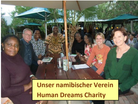
Unser namibischer Verein Human Dreams Charity