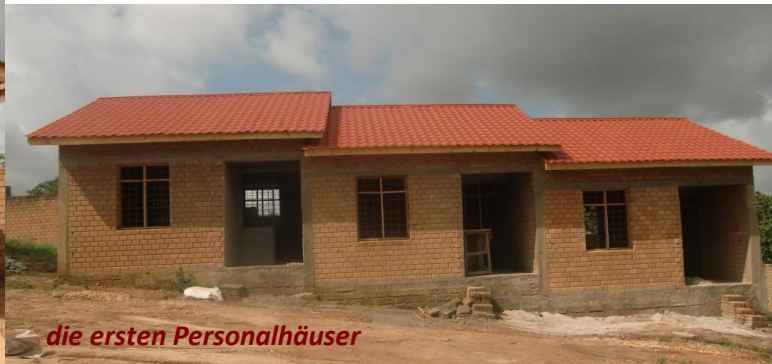
die ersten Personalhäuser