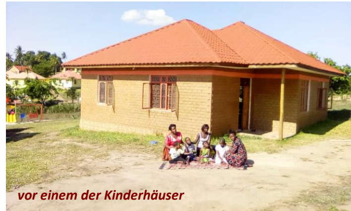
vor einem der Kinderhäuser

Mittlerweile ist unsere Kindertagesstätte zu einem zweiten Kinderdorf in Tansania herangewachsen. Beide Kinderhäuser sind bereits in Betrieb, sechs weitere folgen. Auch unser schöner Bus, dessen Sitze wir behindertengerecht gestaltet haben, hat die Fahrt mit elf pflegebedürftigen Kindern aufgenommen. Unsere aus der Schweiz kopierte Toilette ist bestimmt die schönste in ganz Tansania 😊 und in wenigen Wochen sind unsere ersten drei Personalhäuser bezugsfertig.