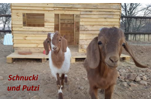
Schnucki und Putzi