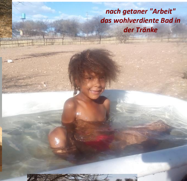
nach getaner "Arbeit" das wohlverdiente Bad in der Tränke

möglich, Lungenentzündungen aufgrund von Aspiration zu vermeiden. Wie man es dazu noch in einer Wellblechhütte bei Hitze und Kälte aushalten kann ist nur schwer vorstellbar. Doch genau das ist das Schicksal vieler pflegebedürftigen Kinder hier in Namibia, da sie aufgrund von fehlender Aufklärung nur allzu häufig vor der Gesellschaft versteckt werden. In wenigen Monaten werden auch diese Kinder in unserer Therapiestelle endlich Grund zur Freude haben!